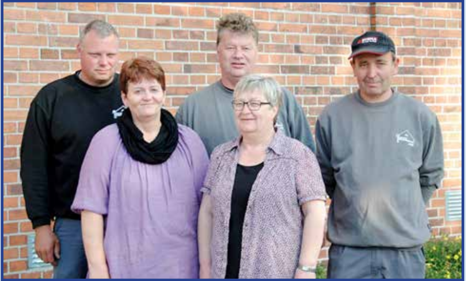
Medarbejdere - Padbo