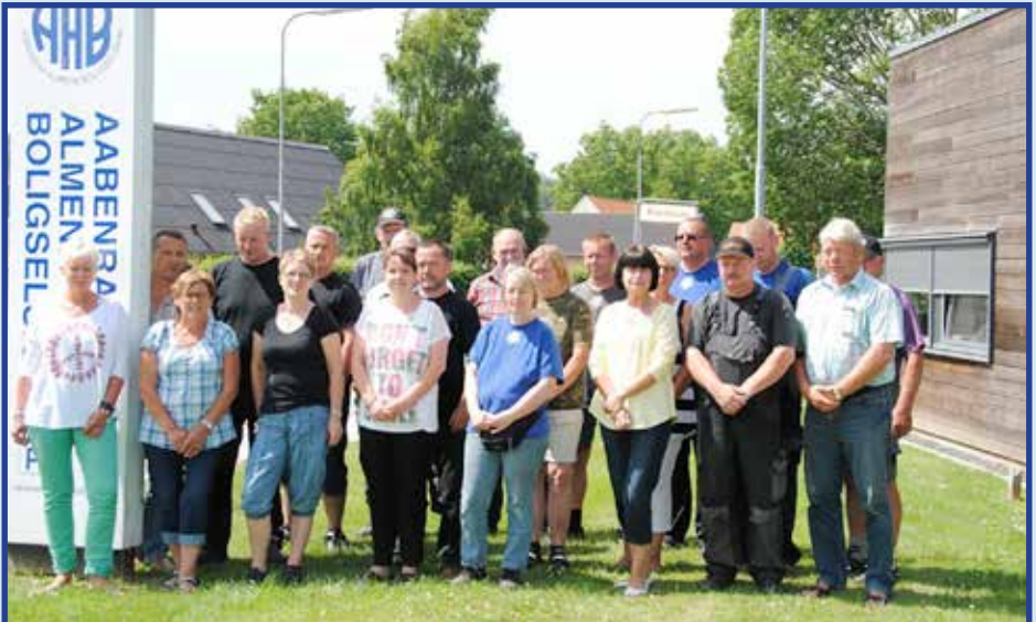
Medarbejdere - ÅAB